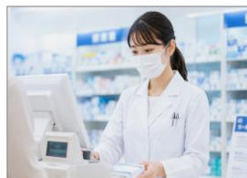
1階に調剤薬局あり (写真はイメージ)