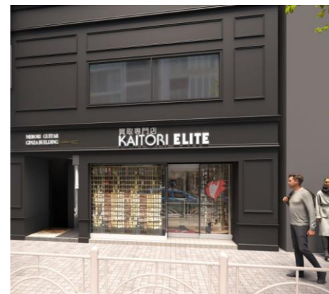
※外観リニューアル工事後イメージCG