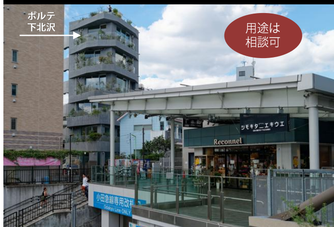
南西口の「シモキタエキウエ」から徒歩1分の視認性の高いビル

スケルトン天井の想定床～天井までの高さ3.2-3.47m、階高3.6-3.7m、窓サッシ高2.75m