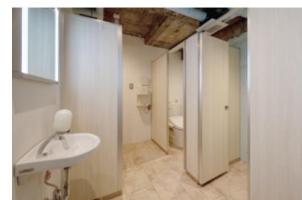
3Fにある女子トイレは洗面台・ブースとも2つ