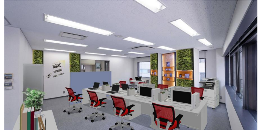
フェイクグリーンでクリエイティブなイメージにした追加内装工事とセットアップの事例（CG合成）（施工方法、内容によっては原状回復工事費用が多額になるケースもあります。）

上記は会議室を作らない場合のご参考であり、全く同一のレイアウトが可能であることを保証するものではありません。実際の精緻なレイアウトサポートをご希望の場合はご相談ください。（別途有料）