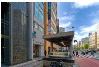
淡路町・小川町駅のA2出口からは徒歩2分。