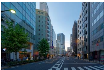
外堀通りからワテラスタワーが見えます。 (安和司町ビルから450m徒歩6分)