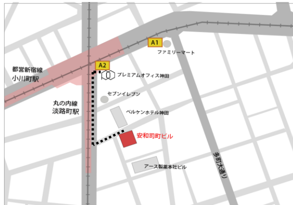
徒歩2分の淡路町・小川町駅のA2出口すぐ目の前のビルです。

ご契約オプション～弊社が運営する「PREMIUM OFFICE 神田」のご紹介（有料予約制の会議室もご利用可能・男女別トイレ有）