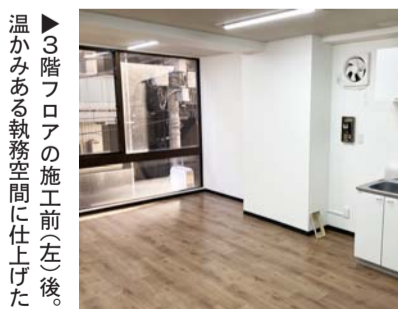
3階フロアの施工前左後。温かみある執務空間に仕上げた

「Logran」御徒町ビル」は10階と4階のそれぞれ63・55坪をセットアップ仕様や気分に合わせて自由に。複数の空間リノベーションのプランを、配する家具のプランをプロパティール・パートナーズ側が用意し、物件オーナーが好みのも