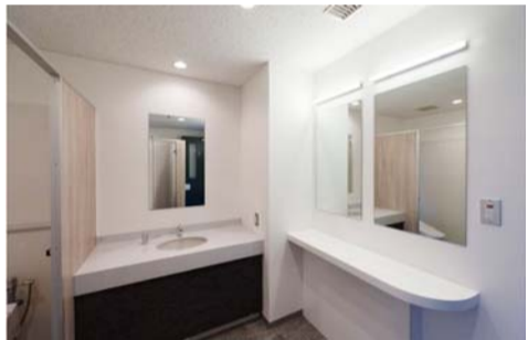
女子トイレのブースを増設