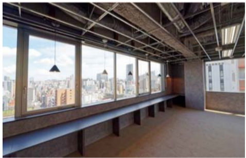
窓際をカウンター席に

「Logran」御徒町ビル」ならびに東京メトロ「半蔵門」駅徒歩2分の「PREMIUM OFFICE 麹」(自区分所有)の町2拠点でセットアップオフィスの提供を始め