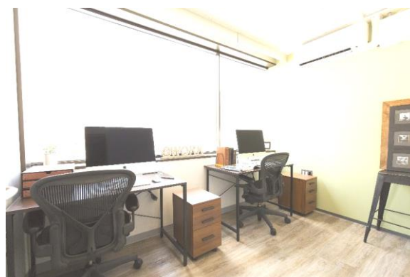
個室オフィス 322号室-1

基本利用料は月々39,000円/1名から。継続して入居する際の更新料、契約終了時の退室料金もかかりません。1坪～3坪の個室オフィスで、プリンターや、定員分のデザイン性の高い机や椅子を無料でご用意。無料無線Wi-Fi、無料有線LANも常設しており、初期費用を抑えることができ、スタートアップ起業家がPC1台のみでもすぐに仕事ができる環境が整っています。