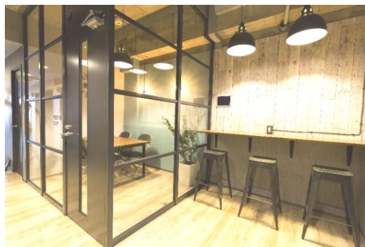
カウンタースペース～ミーティングルーム

また、プロパティ・パートナーズには、企業再生の実務も経験した税務・法務・会計・会社設立に詳しい社内スタッフがおり、外部プレーンとの付き合いもあるため、起業アドバイザーとしても多方面から最良な提案ができ、安心して入居可能です。